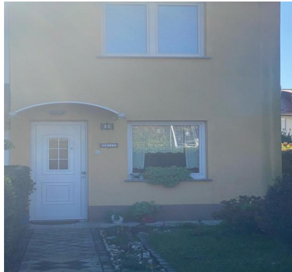
Slika 1: Sjedište Društva

U nastavku je slika poslovne adrese Velika Gorica, Trg Grada Zagreba 11;